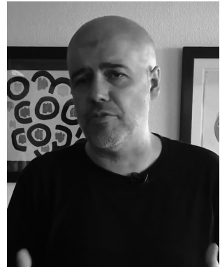
Unai Sordo, secretario general de CC. OO.

Nuevos empleos que, para Unai Sordo, secretario general de CC. OO., necesitarán «políticas sectoriales». Políticas que permitan ver los sectores en desarrollo en las próximas décadas. Así como para convertirse en planes de formación permanente para todos los trabajadores, «como pasarela a empleos de calidad y estables», abundó.