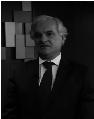
Miguel Garrido, presidente de la CEIM

Y es que el escenario laboral que se vislumbra, ya impulsado hace años por la digitalización y la transición energética, se ha visto acelerado por la pandemia. Las nuevas plataformas y el trabajo telemático darán lugar a nuevas ocupaciones y competencias asociadas.