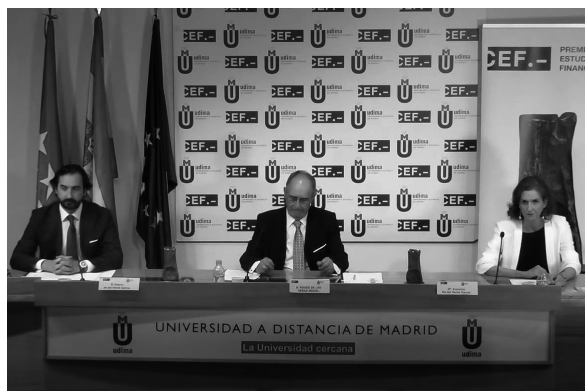
Mesa presidencial ubicada en el salón de actos de la UDIMA

El CEF.- Centro de Estudios Financieros celebró el miércoles 30 de septiembre la ceremonia de entrega de la XXX edición del Premio Estudios Financieros desde el salón de actos del campus de la Universidad a Distancia de Madrid, UDIMA, evento que se desarrolló en directo vía online , siguiendo las recomendaciones de las autoridades sanitarias, con el fin de reducir riesgos de propagación del coronavirus.