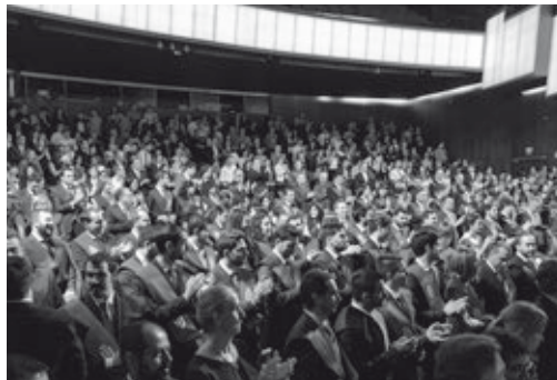
Los asistentes completaron el aforo del teatro