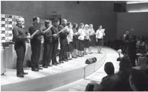
El coro interpretando compases de la zarzuela Luisa Fernanda