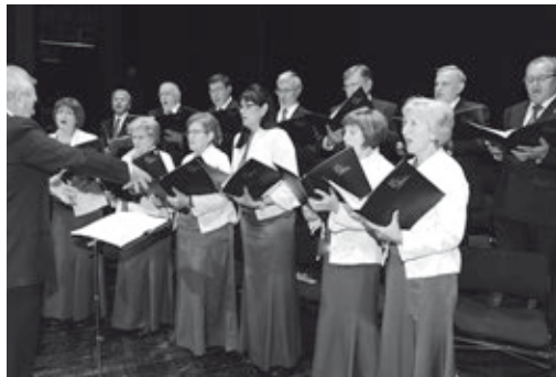
La presencia del coro aportó solemnidad a la ceremonia

Tras las palabras del fundador del CEF.- se clausuró el acto, como no podría ser de otra manera, con el himno universitario por excelencia, Gaudeamus igitur , nuevamente interpretado por el magnífico coro.