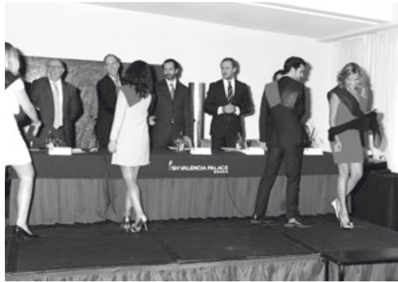
Los nuevos titulados recibieron la felicitación personal de todos los miembros de la mesa presidencial

Un año más hemos despedido a una promoción de excelentes estudiantes que estamos seguros de que conseguirán un gran éxito profesional al igual que tantos otros tras su paso por el CEF.-, y muchos de ellos ahora pasarán a formar parte de la ACEF donde podrán seguir cultivando su amistad y colaborando en su desarrollo profesional.