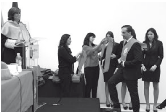
Imposición de becas a los egresados

más joven de la Universidad, quien cursó el año pasado uno de los programas de inglés del Instituto de Idiomas de la UDIMA. «Nos sentimos orgullosos de todos vosotros y compartimos vuestros éxitos, ya que nuestra profesión no es enseñar sino lograr que vosotros aprendáis», les dijo a los estudiantes.