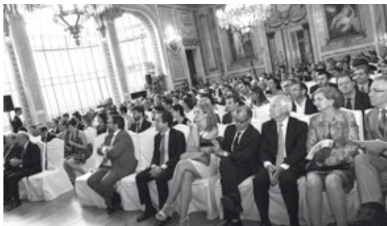
Panorámica de los asistentes en el Salón Real del Casino de Madrid

Semejante efeméride merecía sin duda una celebración a la altura. Es por ello que en esta oportunidad la ceremonia de entrega de estos preciados galardones tuvo lugar en un sitio emblemático como sin duda es el Casino de Madrid. Un edificio singular, erigido en 1835, y que albergó un acto que estuvo cargado de emoción y en el que compartieron protagonismo los premiados de la presente edición con el repaso de una brillantísima trayectoria que ha alcanzado ya el cuarto de siglo.