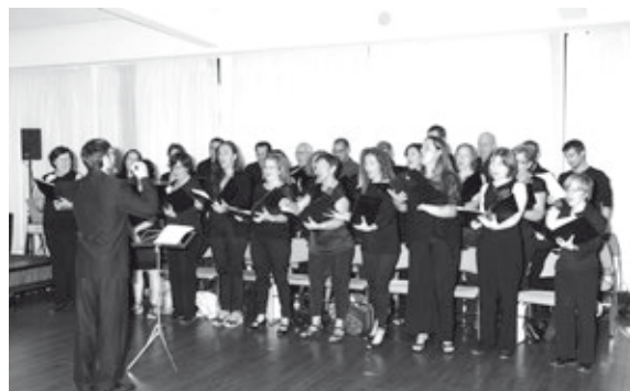
El coro Alameda durante una de sus intervenciones

También rendimos homenaje a todos aquellos alumnos del área de oposiciones que a lo largo de este curso han superado las pruebas que dan acceso a la condición de funcionario de carrera. Muchos de ellos se encuentran en el destino asignado o realizando los cursos de formación como funcionarios en prácticas. Otros, en representación de todos ellos, asistieron a este acto.