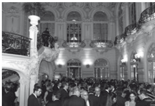
En el patio de honor del Casino de Madrid se sirvió el cóctel