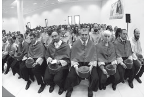
Panorámica de los asistentes a la graduación y claustro de profesores

felicitándoles por el logro alcanzado, y recordándoles que «los esfuerzos realizados son pequeños en comparación a las oportunidades que os abren los títulos que hoy se os entregan». Con palabras de cariño presentó a los asistentes la evolución del CEF.- y los logros alcanzados como centro preparador de funcionarios y organizador de másteres y cursos, además de su importante labor editorial.