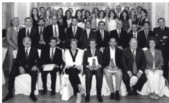
Jurados y premiados de la XXV edición

Por primera vez desde que se celebra la ceremonia de entrega del Premio Estudios Financieros, hubo en ella un lugar y reconocimiento explícito para quienes sin haber alcanzado la gloria de llevarse ninguno de los galardones concedidos, sí habían quedado a las puertas al quedar finalistas. Uno tras otro, fueron llamados por su nombre, y una nutrida representación de ellos, pues eran muchos los presentes en la sala, fueron subiendo al estrado a recibir el reconocimiento público y un diploma acreditativo.