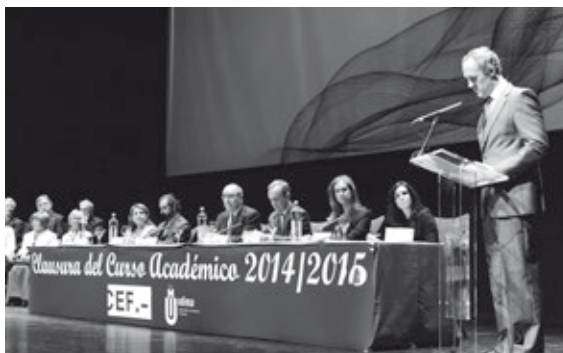
Mesa presidencial durante el discurso del rector de la UDIMA