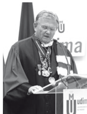
El padrino de la promoción durante su lección magistral