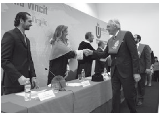
Los nuevos titulados reciben la felicitación de la mesa presidencial