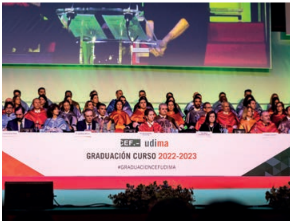
Panorámica de la mesa presidencial

Al amparo del solemne acto de graduación de alumnos de grado y máster del curso académico 2022-2023, el Grupo Educativo CEF.- UDIMA aprovechó la ocasión para escenificar también el merecido reconocimiento a los restantes ganadores del trigésimo tercer Premio Estudios Financieros el pasado 4 de noviembre. Así, además de rendir homenaje a los más de 460 alumnos que superaban este año sus estudios superiores, por la tarima del Palacio Municipal