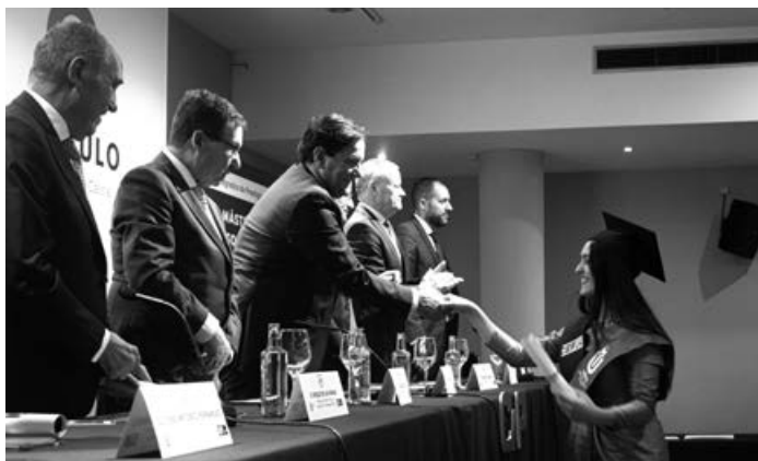
Todos los egresados recibieron la felicitación personal de todos los miembros de la mesa presidencial