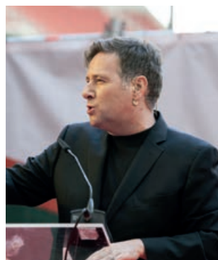
El cómico Carlos Latre

Tras el reconocimiento oficial a los estudiantes, el acto de celebración prosiguió con la desternillante intervención del cómico, imitador y showman Carlos Latre, y la sesión musical del violinista Pablo Navarro, acompañado de dj y piano, para cerrar la mañana.