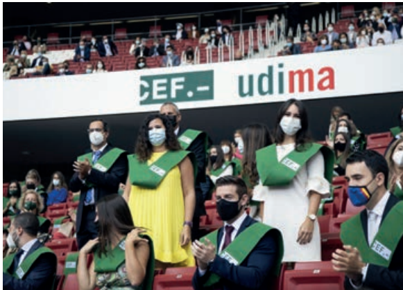
Los alumnos ocuparon las gradas del estadio Wanda Metropolitano

«Pese a las dificultades habéis demostrado resiliencia, que os ayudará frente a las próximas adversidades en vuestra carrera profesional», concedía la rectora. También recordó «con cariño» a los estudiantes de las Islas Canarias, en especial a los de La Palma, a quienes mandó un mensaje de ánimo ante «los difíciles momentos que están atravesando».