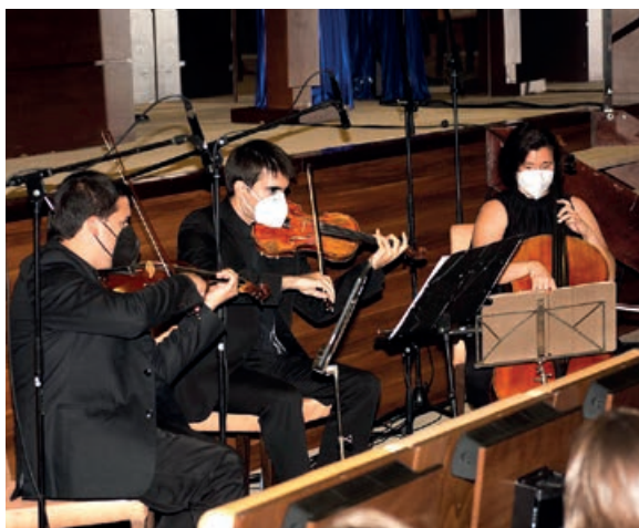
Grupo Arias Opera di Roma

Un año más hemos despedido a una promoción de excelentes estudiantes que estamos seguros de que conseguirán un gran éxito profesional, al igual que tantos otros tras su paso por el CEF.-, y muchos de ellos ahora pasarán a formar parte de la Alumni CEF.- UDIMA, donde podrán seguir cultivando su amistad y colaborando en su desarrollo profesional.