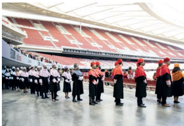
Comitiva de los doctores universitarios

De nuevo en persona, y en un escenario a la altura del esfuerzo realizado por los estudiantes y profesores en los últimos dos años académicos, marcados por la pandemia, el Grupo Educativo CEF.- UDIMA celebró el Solemne Acto de Graduación de sus alumnos de grados y másteres, así como el acto de Reconocimiento a los Opositores. El clásico Gaudeamus igitur sonaba en esta ocasión en el estadio Wanda Metropolitano de Madrid para reconocer a los egresados, posgraduados y opositores de los cursos 2019-2020 y 2020-2021.