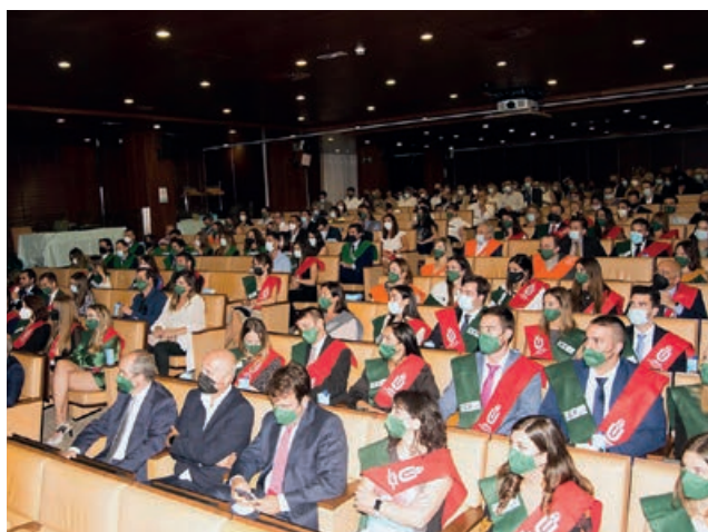
Panorámica del salón de actos

El pasado 5 de octubre tuvo lugar en Valencia el acto de graduación y de reconocimiento a opositores de los cursos 2019-2020 y 2020-2021 de la Universidad a Distancia de Madrid, UDIMA, y del CEF.- Centro de Estudios Financieros.