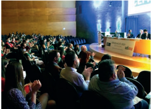
Panorámica del auditorio AXA