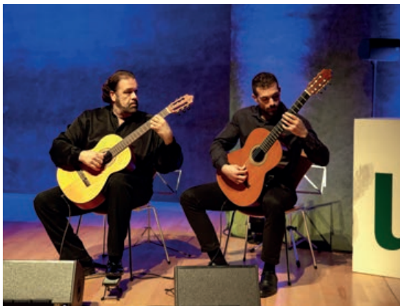
Dúo de guitarras