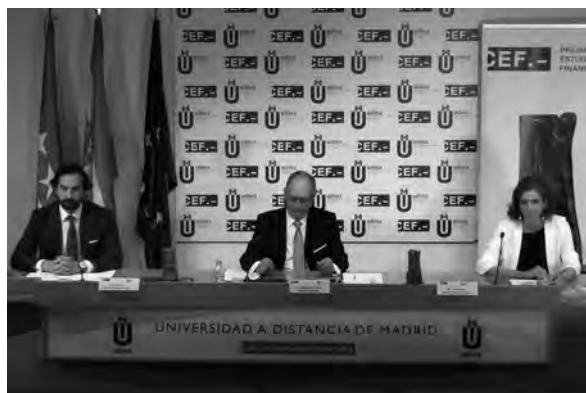
Mesa presidencial ubicada en el salón de actos de la UDIMA

El CEF.- Centro de Estudios Financieros celebró el miércoles 30 de septiembre la ceremonia de entrega de la XXX edición del Premio Estudios Financieros desde el salón de actos del campus de la Universidad a Distancia de Madrid, UDIMA, evento que se desarrolló en directo vía online , siguiendo las recomendaciones de las autoridades sanitarias, con el fin de reducir riesgos de propagación del coronavirus.