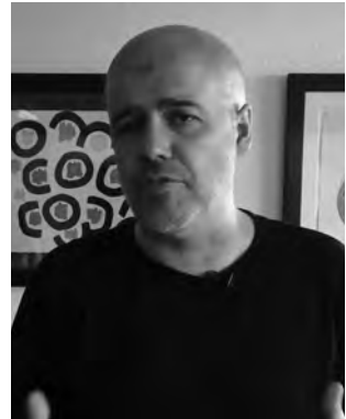
Unai Sordo, secretario general de CC. OO.

Nuevos empleos que, para Unai Sordo, secretario general de CC. OO., necesitarán «políticas sectoriales». Políticas que permitan ver los sectores en desarrollo en las próximas décadas. Así como para convertirse en planes de formación permanente para todos los trabajadores, «como pasarela a empleos de calidad y estables», abundó.