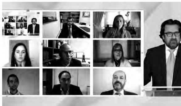
La pantalla múltiple fue la herramienta de comunicación

Muchos proyectos surgieron durante el confinamiento, a veces fruto de las novedades jurídicas que imponía el estado de alarma. Y también hubo anécdotas: dos de los premiados han sido reconocidos más de una vez, uno de los cuales decía sentirse ya «como en casa». Otro premio se quedó literalmente en familia, pues premió a padre e hija con un mismo trabajo elaborado a dos manos.