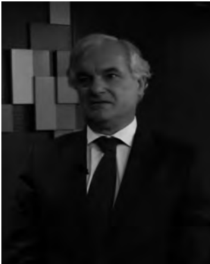
Miguel Garrido, presidente de la CEIM

Y es que el escenario laboral que se vislumbra, ya impulsado hace años por la digitalización y la transición energética, se ha visto acelerado por la pandemia. Las nuevas plataformas y el trabajo telemático darán lugar a nuevas ocupaciones y competencias asociadas.