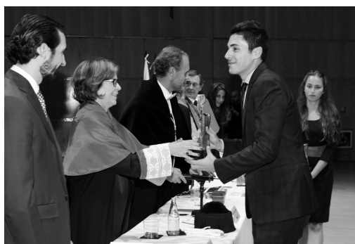
Los premiados recogieron las estatuillas y los diplomas acreditativos

Tras el acto académico, y mientras los estudiantes recogían sus diplomas en las mesas habilitadas al efecto, se sirvió un cóctel en el vestíbulo del palacio.