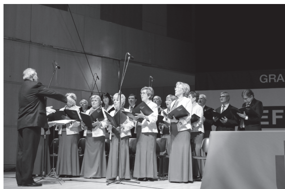
El coro interpretando los acordes del Gaudeamus igitur

creador del Premio Estudios Financieros, don Roque DE LAS HERAS MIGUEL, cerró las intervenciones de la jornada. El acto concluyó con la interpretación por parte del coro del tradicional himno universitario Gaudeamus igitur , tras lo cual el rector declaró solemnemente inaugurado, en nombre de su majestad el rey, el curso académico 2016-2017.