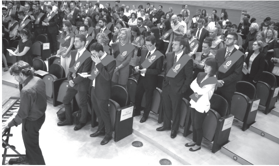
Los recién titulados durante la celebración

para desarrollar tareas como mediar entre el alumno y la materia de aprendizaje, enseñar a aprender, desarrollar el talento y motivar al alumnado. Tareas que, si bien son un plus de estrés adicional a la actividad profesional diaria, no se convierten en distrés , en el famoso síndrome del quemado por el trabajo, porque esta actividad nos mantiene automotivados para continuar con esta aventura de desarrollar el talento de las personas que continúan depositando su confianza en nuestro Centro.