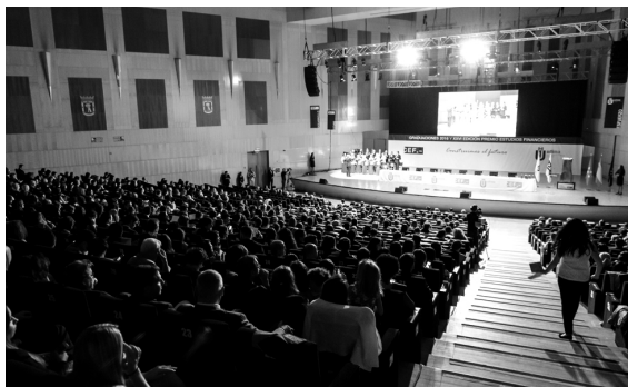
Panorámica general del auditorio del Palacio Municipal de Congresos

Tantas efemérides felices y tan próximas en el tiempo llevaron a los responsables del Grupo CEF.- UDIMA a pensar en una ocasión especial que sirviera para albergarlas a todas y que reuniera a muchas de las personas que durante estos años han contribuido, con su esfuerzo y amor por el trabajo, al éxito de cada uno de estos proyectos. De ahí que, por primera vez en la historia de estas instituciones, este año se celebrara en un único acto académico la graduación de los alumnos de CEF.- y UDIMA del curso 2015-2016 y la entrega de la XXVI edición de Premio Estudios Financieros. Todo un desafío desde el punto de vista organizativo –no en vano, fueron más de 2.000 personas las convocadas entre alumnos, profesores, premiados, familiares, empleados y personalidades–, cuyos responsables supieron sacar adelante con diligencia y brillantez.