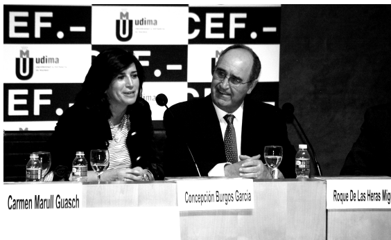
El presidente del Grupo, atento a las palabras de la nueva rectora

hizo una amena y serena intervención reflexionando sobre los avatares de la vida profesional, que siempre debe ir acompañada de valores éticos y creencias irrenunciables, y será plena si aquellas cosas cotidianas, pequeñas, consiguen que cada día, al menos un rato, disfrutemos yendo a trabajar a pesar de los muchos problemas a los que nos enfrentemos, nervios y horas que le dediquemos.