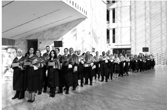
Comitiva de doctores de la UDIMA

el denominador común en una ceremonia muy compleja desde el punto logístico en la que desfilaron por el escenario cientos de personas. Empezando por todos y cada uno de los alumnos graduados, tanto de grado como de máster, quienes, en presencia de una nutrida representación de sus profesores, recibieron el homenaje en forma de aplauso por el título obtenido. También lo hicieron los tres nuevos doctores surgidos de esta promoción de la UDIMA, acompañados por sus respectivos directores de tesis, y a quienes el rector impuso su birrete de doctor y la medalla de la Universidad. De igual modo, en la parte final del acto subieron a recibir sus estatuillas, diplomas acreditativos y dotaciones económicas los ganadores del Premio Estudios Financieros.