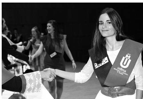
Todos los alumnos recibieron la felicitación personal de los miembros de la mesa presidencial