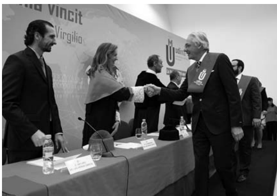
Los nuevos titulados reciben la felicitación de la mesa presidencial