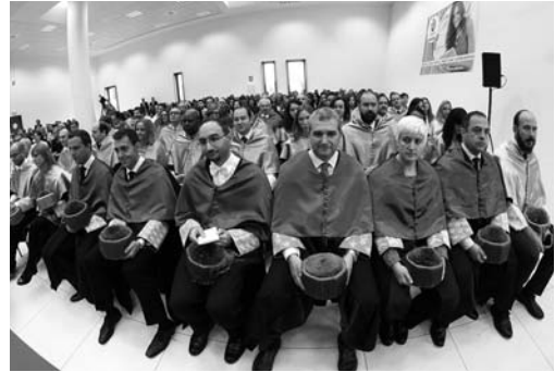
Panorámica de los asistentes a la graduación y claustro de profesores

felicitándoles por el logro alcanzado, y recordándoles que «los esfuerzos realizados son pequeños en comparación a las oportunidades que os abren los títulos que hoy se os entregan». Con palabras de cariño presentó a los asistentes la evolución del CEF.- y los logros alcanzados como centro preparador de funcionarios y organizador de másteres y cursos, además de su importante labor editorial.