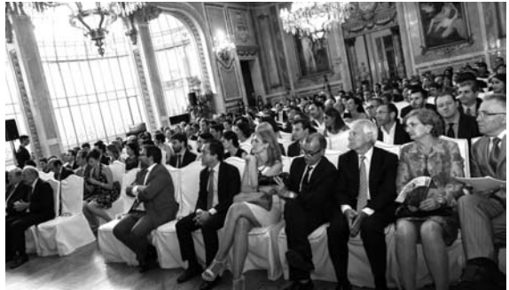
Panorámica de los asistentes en el Salón Real del Casino de Madrid

Semejante efeméride merecía sin duda una celebración a la altura. Es por ello que en esta oportunidad la ceremonia de entrega de estos preciados galardones tuvo lugar en un sitio emblemático como sin duda es el Casino de Madrid. Un edificio singular, erigido en 1835, y que albergó un acto que estuvo cargado de emoción y en el que compartieron protagonismo los premiados de la presente edición con el repaso de una brillantísima trayectoria que ha alcanzado ya el cuarto de siglo.