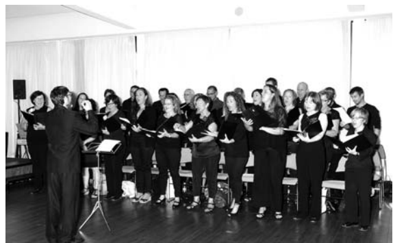
El coro Alameda durante una de sus intervenciones

También rendimos homenaje a todos aquellos alumnos del área de oposiciones que a lo largo de este curso han superado las pruebas que dan acceso a la condición de funcionario de carrera. Muchos de ellos se encuentran en el destino asignado o realizando los cursos de formación como funcionarios en prácticas. Otros, en representación de todos ellos, asistieron a este acto.