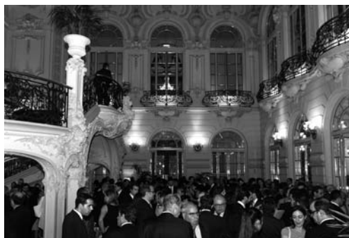
En el patio de honor del Casino de Madrid se sirvió el cóctel