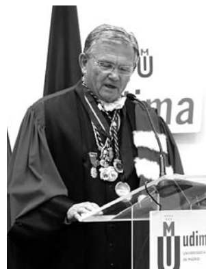
El padrino de la promoción durante su lección magistral