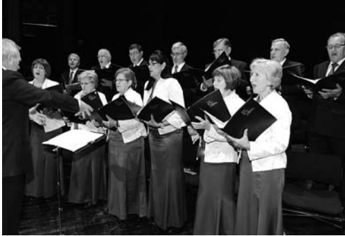
La presencia del coro aportó solemnidad a la ceremonia

Tras las palabras del fundador del CEF.- se clausuró el acto, como no podría ser de otra manera, con el himno universitario por excelencia, Gaudeamus igitur , nuevamente interpretado por el magnífico coro.