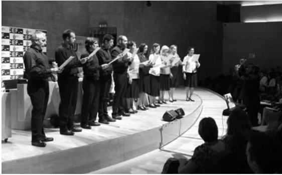
El coro interpretando compases de la zarzuela Luisa Fernanda