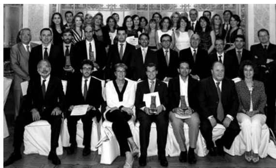
Jurados y premiados de la XXV edición

Por primera vez desde que se celebra la ceremonia de entrega del Premio Estudios Financieros, hubo en ella un lugar y reconocimiento explícito para quienes sin haber alcanzado la gloria de llevarse ninguno de los galardones concedidos, sí habían quedado a las puertas al quedar finalistas. Uno tras otro, fueron llamados por su nombre, y una nutrida representación de ellos, pues eran muchos los presentes en la sala, fueron subiendo al estrado a recibir el reconocimiento público y un diploma acreditativo.