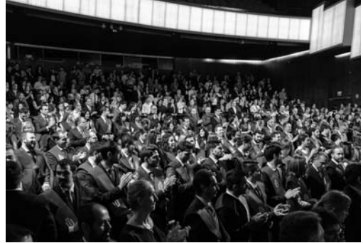
Los asistentes completaron el aforo del teatro