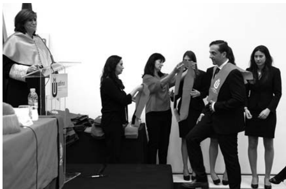
Imposición de becas a los egresados

más joven de la Universidad, quien cursó el año pasado uno de los programas de inglés del Instituto de Idiomas de la UDIMA. «Nos sentimos orgullosos de todos vosotros y compartimos vuestros éxitos, ya que nuestra profesión no es enseñar sino lograr que vosotros aprendáis», les dijo a los estudiantes.