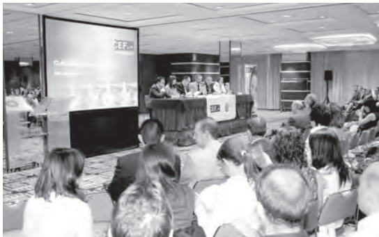
Vista panorámica del acto de Valencia

Un año más hemos despedido a una promoción de excelentes alumnos que estamos seguros conseguirán un gran éxito profesional al igual que tantos otros tras su paso por el CEF, y muchos de ellos ahora pasarán a formar parte de la ACEF donde podrán seguir cultivando su amistad y colaborando en su desarrollo profesional.