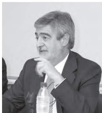
El presidente del jurado de Contabilidad y Administración de Empresas dirigiéndose al auditorio