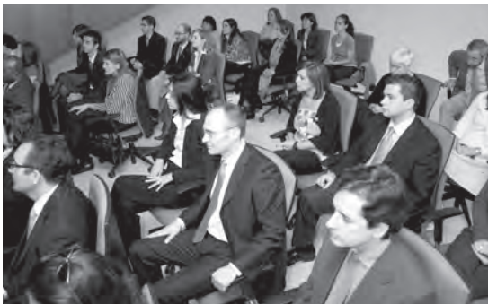
Salón con profesores y personal de administración de la UDIMA asistiendo al acto inaugural del curso 2009-2010

Además, el evento sirvió también para estrenar uno de los edificios del campus de la UDIMA