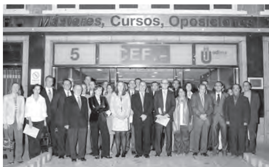
Premiados y jurados en el nuevo acceso de la sede de Viriato-General Martínez Campos

La ceremonia de entrega de la XIX edición el Premio «Estudios Financieros» tuvo este año un carácter más entrañable y familiar que nunca. Y es que en lugar de los acostumbrados oropeles de otras ediciones, cuando esta ceremonia tenía lugar en edificios singulares o emblemáticos de la geografía nacional, como el Caixa Forum de Barcelona (2005), o los madrileños Palacio de Congresos (2006), Casa de América (2007) o Club Financiero Génova (2008), en esta ocasión se optó por una solución más «casera» y cercana al acoger esta efeméride en la nueva sede del CEF en el paseo del General Martínez Campos de Madrid.