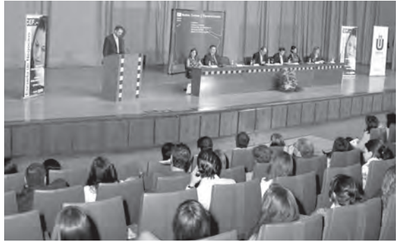
Salón de actos con asistentes a la entrega de diplomas del curso 2008-2009 en Madrid