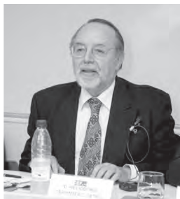
El presidente del jurado de Recursos Humanos dirigiéndose a los asistentes al acto

Precisamente, parte del discurso del vicerrector de la UDIMA estuvo dedicada a destacar el papel, no siempre reconocido en su justa medida, que las instituciones privadas han jugado y juegan en España con sus aportaciones a la cultura y a la investigación. «Hay que dar a estas instituciones el peso y el valor que merecen», reclamó.