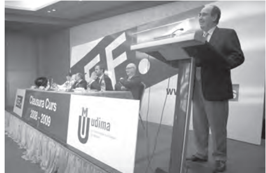
Don Roque de las Heras, durante el acto de clausura del curso académico