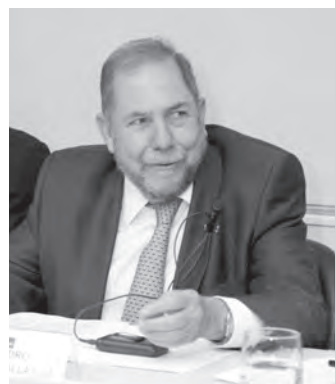
El presidente del jurado de Trabajo y Seguridad Social dirigiéndose al auditorio