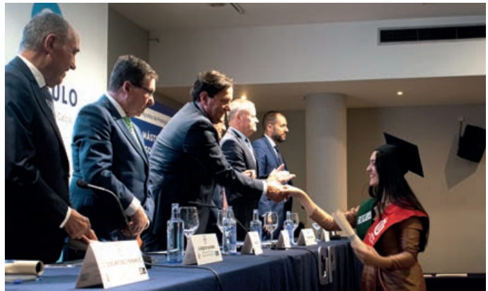
Todos los egresados recibieron la felicitación personal de todos los miembros de la mesa presidencial