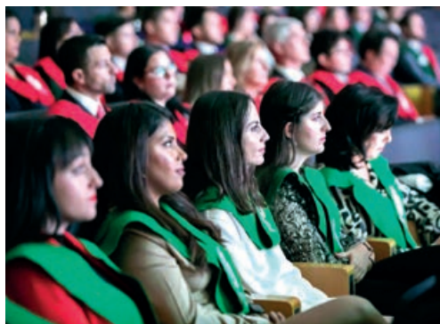
Perspectiva de egresados del CEF.- y la UDIMA