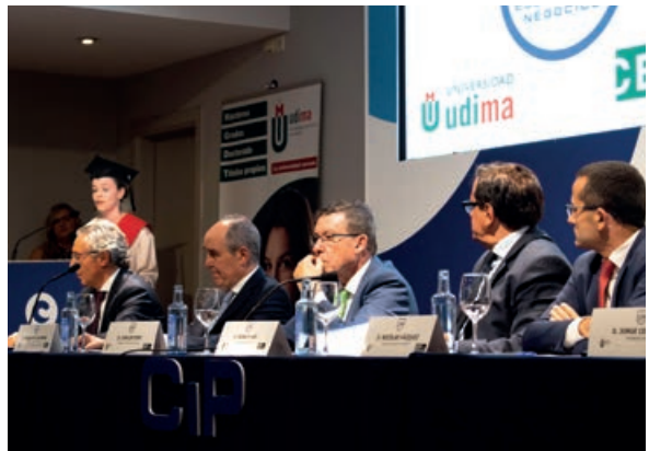
Mesa presidencial del acto